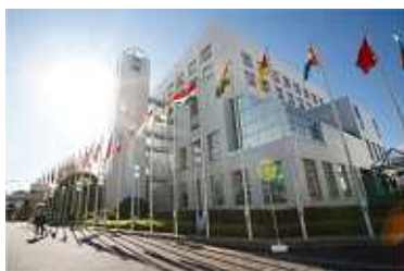
本学第1キャンパス