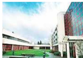
東京国際大学アメリカ校